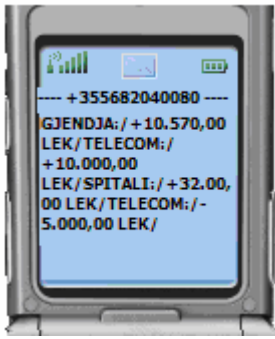
Figura 06: GJËNDJA – Banka i përgjigjet kërkesës së saktë