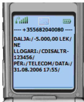
Figura 03: ALARMI – Daljet mbi 1.000 LEK