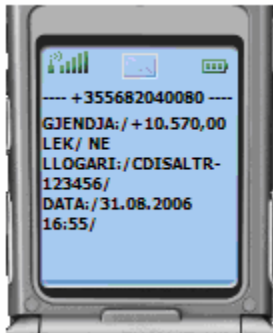
Figura 01: ALARMI - Gjendja mbi 10.000 LEK