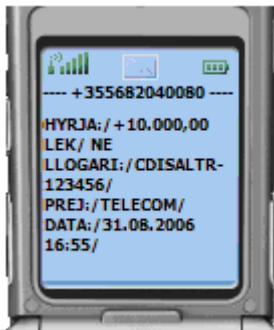
Figura 02: ALARMI - Hyrjet mbi 5.000 LEK