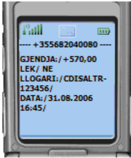
Figura 04: ALARMI - Gjëndja në orën 16:45