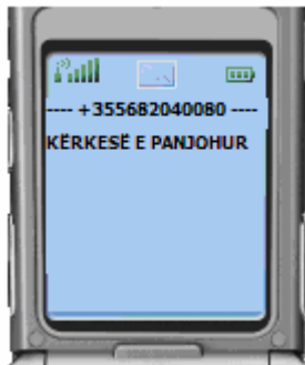
Figura 08: GJËNDJA – KËRKESË E PANJOHUR