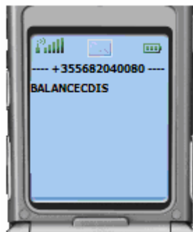
Figura 05: GJËNDJA - Përdoruesi dërgon fjalën kyçe BALANCECDIS

Komunikimi përdorues-bankë kryhet në këtë mënyrë: