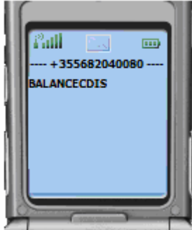
Figura 09: GJËNDJA – Personi nuk është i regjistruar